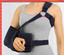
medi SAS° 15 Abduktionslagerung in 15°