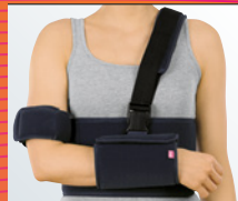
medi Arm fix Ruhigstellung in Innenrotation