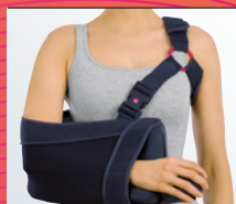
medi SAS° multi Rotationsstabile Lagerung in 15°.