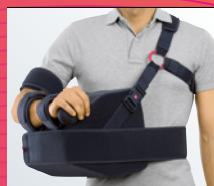
medi SAS° 45 Abduktionslagerung in 30° bis 45°